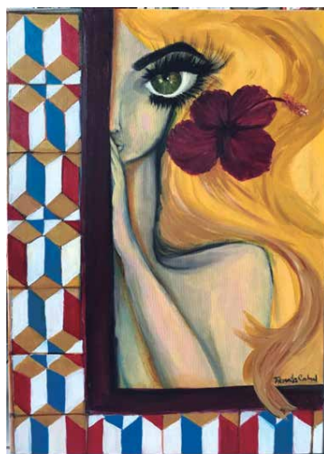
Mostra da artista plástica Renata Cabral é composta por quinze telas