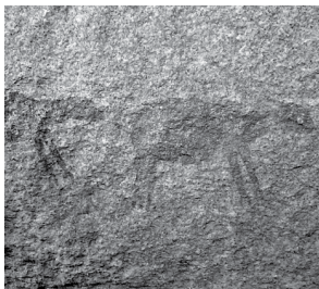
Marcas do homem primitivo localizadas no Cariri paraibano

Todos esses municípios estão à espera dessa oportunidade, a fim de organizarem melhor a memória de cada um, preservando suas importantes evidências históricas, arqueológicas e paleontológicas, submetidas a perversas adversidades, que, sem uma proteção governamental, estarão ameaçadas de extinção, em futuro próximo.