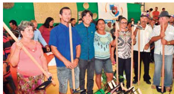
Nesta semana, agricultores de vários municípios foram contemplados.

Inicialmente haverá a distribuição de sementes em 110 municípios destas duas regiões, onde serão atendidos 40 mil agricultores familiares. São 300 toneladas de milho,