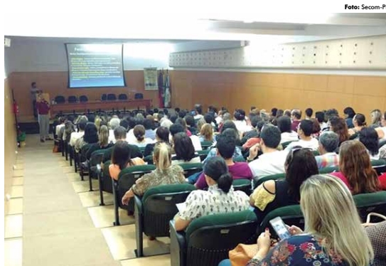
Profissionais da Atenção Básica e estudantes de Pneumologia participam de evento no auditório do CRM

Ao aderir o Sisu, entre outras informações, as instituições devem oferecer a relação dos cursos e turno.